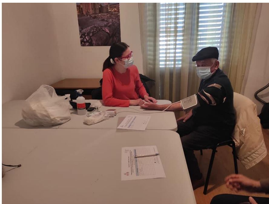
Slika 18. Mjerenje šećera i tlaka umirovljenicima