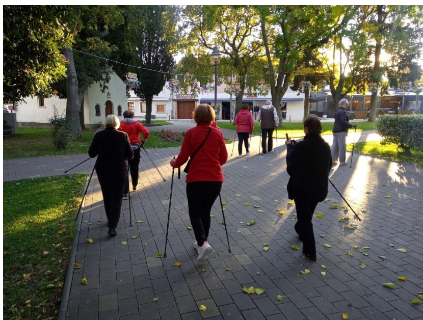
Slika 12. Aktivnosti nordijskog hodanja

Sve aktivnosti u 2021. godini bile su u sklopu projekta Aktivni zajedno.