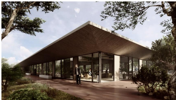
Slika 21. Prikaz idejnog rješenja projekta Društveni kutak

Odobreni iznos projekta je 13.797.528,38 kuna i u potpunosti je financiran bespovratnim sredstvima iz Europskih strukturnih i investicijskih fondova u financijskom razdoblju 2014.-2020.