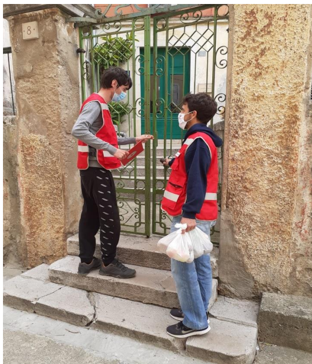
Slika 1. Volonteri GDCK BnM u podjeli humanitarne pomoći korisnicima

Sveukupno je podijeljeno 116.384,77 kg humanitarne pomoći u vrijednosti od preko 907.886,20 kuna.