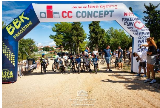
Slika 11. Timovi prve pomoći GDCK Bnm na bicikljadi u Pakoštanima