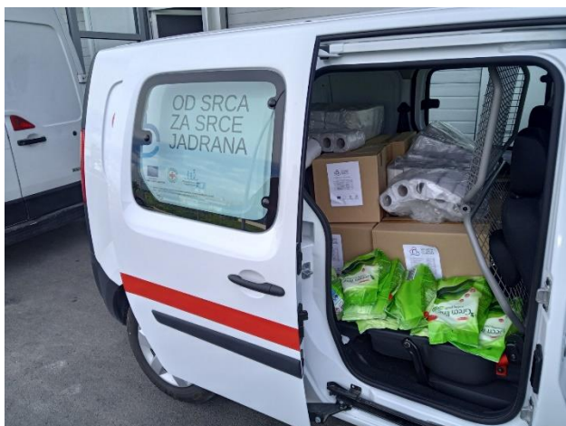
Slika 22. prikazuje pakiranje vozila za distribuciju humanitarne pomoći

Tehničku i stručnu pomoć u provedbi projekta pružio je regionalni koordinator Agencija za razvoj Zadarske županije Zadra Nova.