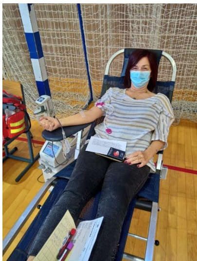
Slika 6. Dobrovoljna darivateljica krvi

Također je prigodno obilježen Svjetski dan darivatelja krvi 14.06. putem pisanih i elektronskih medija te društvenih mreža te je 25. listopada 2021. obilježen Dan dobrovoljnih darivatelja krvi u Republici Hrvatskoj prigodnim sms čestitkama darivateljima te objavama na društvenim mrežama i putem elektronskih medija.