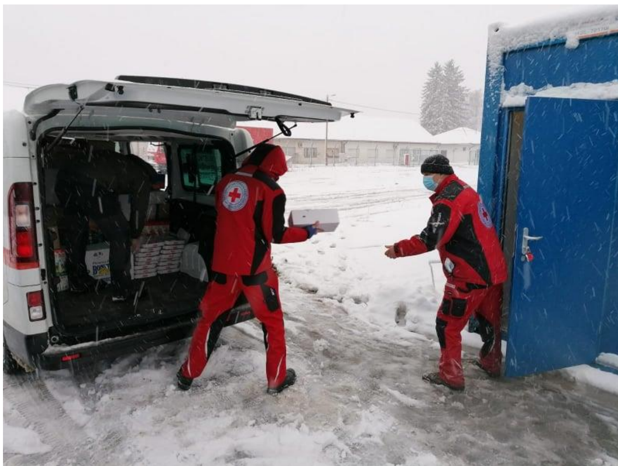
Slika 17. Volonter GDCK Bnm u distribuciji humanitarne pomoći na području Siska i okolice pogođene potresom

Od 27. prosinca do 31. prosinca GDCK Biograd na Moru obilježio je godišnjicu potresa na društvenim mrežama Društva.