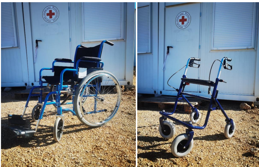
Slika 3. i 4. Prikazuje invalidska kolica i hodalicu iz posudionice pomagala GDCK Bnm

Posudionica ortopedskih pomagala je potpuno besplatna za sve građane područja djelovanja Društva. Posudionica ima invalidska kolica, medicinske krevete, higijenska kolica, štake, hodalice, štapove, dizalo za kadu, dječja invalidska kolica, i ostala manja ortopedska pomagala. Dobili smo u donaciju električna kolica bez punjača stoga još nisu stavljena u korištenje.