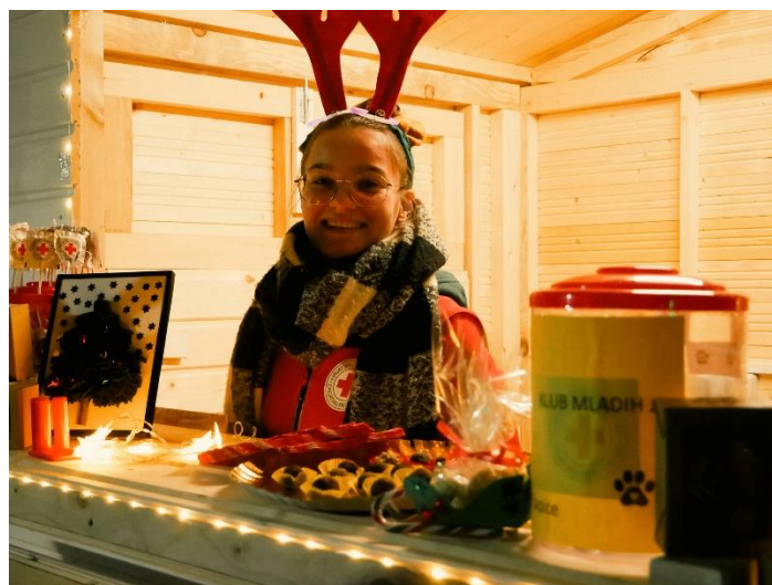
Slika 13. Volonterka GDCK BnM iz Kluba mladih na Božićnom sajmu u Biogradu na Moru

Ukupan broj mladih volontera je 59 , od čega je aktivnih 34 .