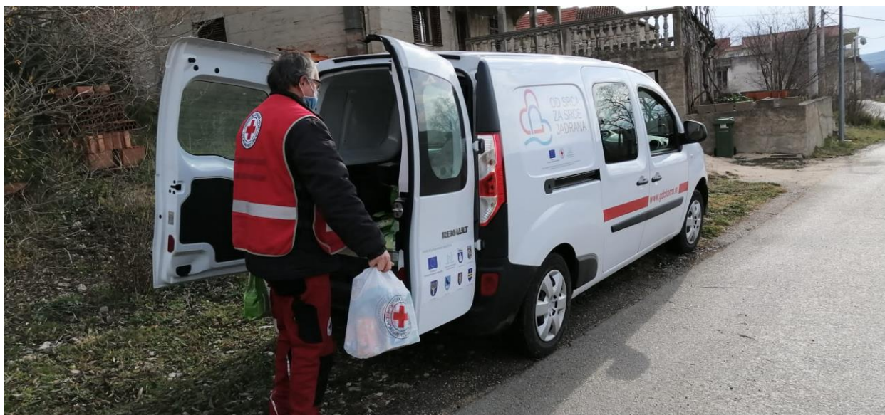
Slika 15. Djelatnik na javnim radovima u podjeli humanitarne pomoći korisnicima GDCK BnM

Hrvatski Crveni križ u suradnji sa Hrvatskim zavodom za zapošljavanje i Ministarstvom za obitelj, demografiju, mlade i socijalnu politiku dogovorio je poseban program zapošljavanja unutar programa mjera Javnih radova. U sklopu toga Gradsko društvo Crvenog križa Biograd na Moru potpisalo je Ugovor o sufinanciranju zapošljavanja u javnom radu kroz Socijalni program GDCK Biograd na Moru i zaposlilo 1 korisnika minimalne zajamčene naknade na pola radnog vremena u trajanju od 1. lipnja 2021. do 28. veljače 2022. godine. Korisnik je zaposlen u svrhu prijevoza i distribucije humanitarne pomoći.