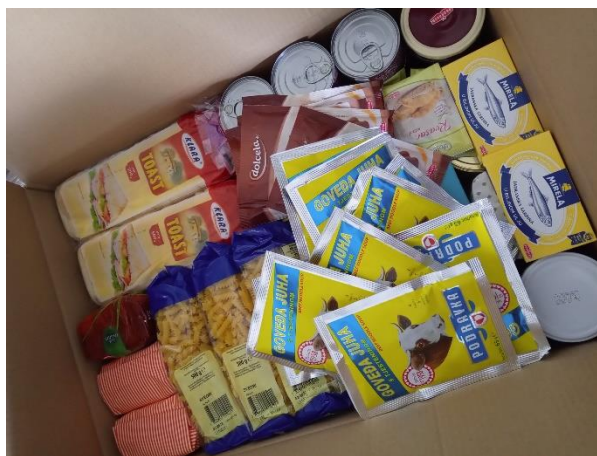
Slika 23. prikazuje FEAD paket koji se dijelio korisnicima