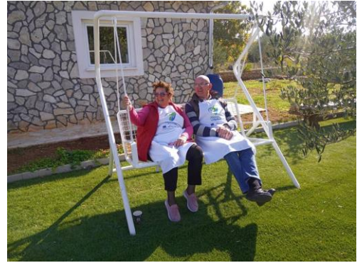
Slika 19. i slika 20. prikazuje druženje biogradskih i vodičkih umirovljenika na kulinarskoj radionici u Vodicama u sklopu projekta Aktivni zajedno