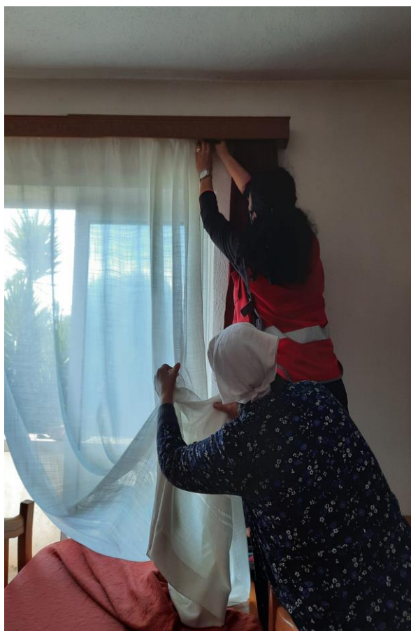
Slike 24. i 25. prikazuje žene iz programa Poželi i stiže ti zaželi s korisnicama o kojima su brinule

Projekt se predstavio na Sajmu strukovnog obrazovanja i osposobljavanja u Biogradu na Moru 6. listopada 2021. godine.