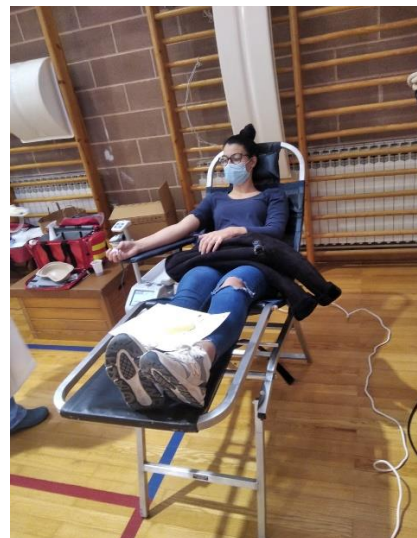
Slika 7. Dobrovoljna darivateljica krvi

Od 29. do 31. listopada organiziran je izlet na Vis za dobrovoljne darivatelje Aktiva Pakoštane i Drage koji je financiran od strane Općine Pakoštane i samih darivatelja.