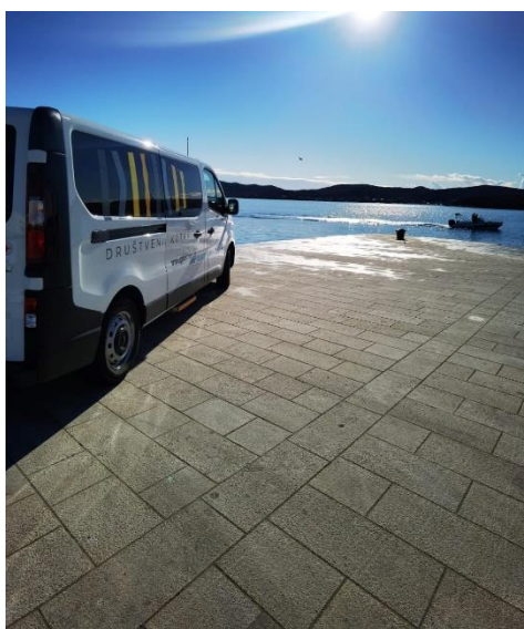
Slika 26. prikazuje vozilo Renault Trafic

Do korisnika se dolazi putem postojeće mreže i kontakata Crvenog križa i Centra za socijalnu skrb Biograd na Moru, internetskim stranicama i društvenim mrežama nositelja, partnera te općina s područja djelovanja GDCK Biograd na Moru te letcima koji su se izradili putem projekta te podijelili na važnim lokacijama. Izravni korisnici obuhvaćeni projektom su osobe starije životne dobi s područja djelovanja GDCK Biograd na Moru.