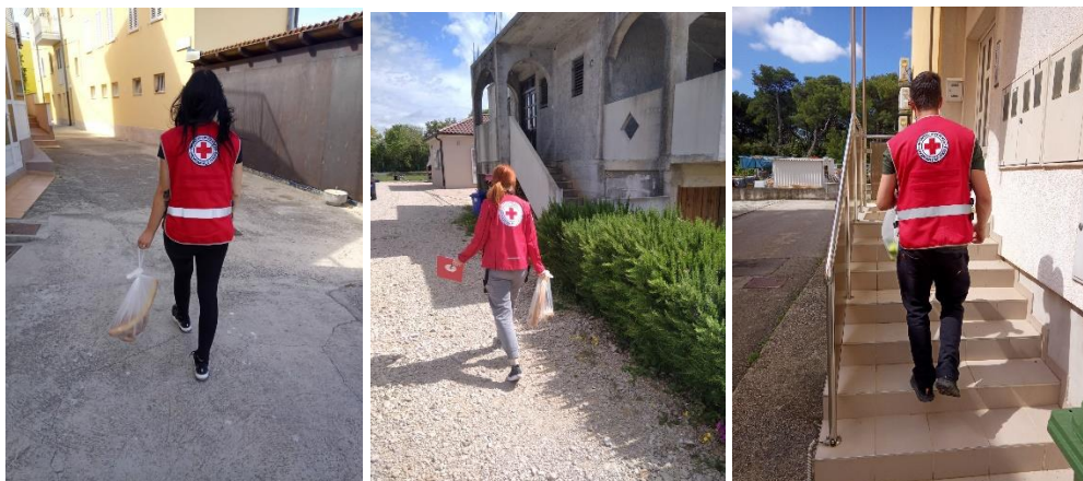
Slika 2. Volonteri GDCK Bnm dostavljaju humanitarnu pomoć, donacije Kauflanda

Sve donacije podijeljene su korisnicima na području djelovanja Gradskog društva Crvenog križa Biograd na Moru.