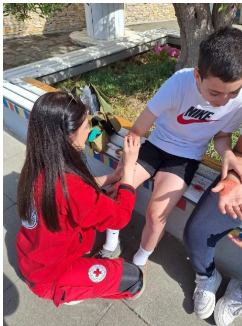
Slike 19. i 20. Vježba sustava civilne zaštite