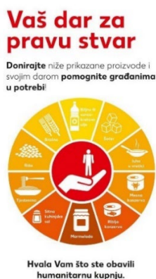
Slika 12. Letak akcije „Vaš dar za pravu stvar“

U povodu Tjedna Crvenog križa, Hrvatski Crveni križ i njegova društva od 8. do 15. svibnja prikupljala su prehrambene artikle u košarama koje su bile postavljene u trgovinama Kauflanda. Prikupljale su se namirnice koje sadrži paket hrane „Vaš dar za pravu stvar“ - sol, brašno, ulje, šećer, riža, tjestenina, juha u vrećici, riblje i mesne konzerve, a GDCK Biograd na Moru je prikupilo ukupno 12,5 kg namirnica.