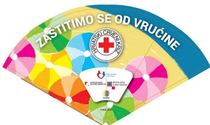
Slika 9. Kartonska lepeza „Zaštitimo se od vrućine“

U lipnju 2024. godine građanima su putem društvenih mreža podijeljeni savjeti za zaštitu od vrućine osobama starije životne dobi, a podijeljene su i promotivne kartonske lepeze „Zaštitimo se od vrućine“ koje je izradilo Ministarstvo zdravstva, Hrvatski zavod za javno zdravstvo, Hrvatski zavod za hitnu medicinu i DHMZ starijim osobama te dobrovoljnim darivateljima na akcijama dobrovoljnog darivanja krvi. Svi važni datumi obilježeni su online, preko društvenih mreža i web stranice GDCK.