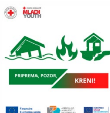
Slika 15. Logo projekta „Priprema, pozor, kreni!“

s ciljem smanjenja negativnih posljedica. Mladi kroz ovakve projekte imaju priliku pružiti potporu u postupku učenja te utvrđivanju i dokumentiranju ishoda učenja putem EU alata za vrednovanje kao što je Youthpass – instrument za vrednovanje i priznavanje u programu „Mladi na djelu“. Projekt „Priprema, pozor, kreni!“ sufinancira Agencija za mobilnost i programe Europske unije u iznosu od 6.888 EUR, a prijavljen je u okviru Europskih snaga solidarnosti kao Projekt solidarnosti. Trajanje projekta je 12 mjeseci. Od početka trajanja projekta održano je 7 radionica u DV „Gardelin“ Pakoštane s preko 100 polaznika, na temu priprema za krizne situacije te je nabavljena oprema, a održane su i 2 javne edukacije . Redovito se objavljivala i online kampanja na društvenim mrežama samog projekta, kao i na web stranici te društvenim mrežama GDCK Biograd na Moru. Provedba projekta je bila i medijski popraćena. Provedba projekta završila je 31. prosinca 2023. godine a krajnji izvještaj odobren je u travnju 2024. godine.