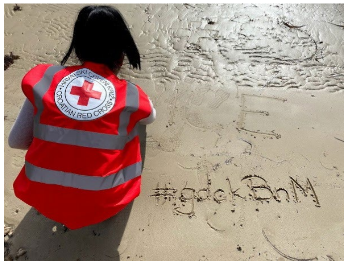
slika 1. Volonterka GDCK BnM

Sve djelatnosti propisane Statutom Društva i Zakonom o Hrvatskom Crvenom križu realiziramo preko svojih ustrojstvenih oblika i volontera bez kojih ne bi bilo moguće odraditi sve zadaće i odgovoriti na potrebe sredine u kojoj djelujemo.