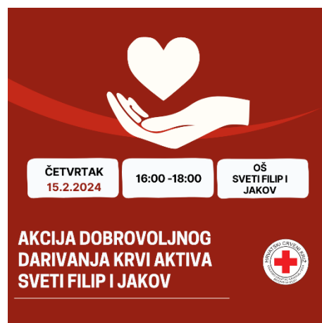
slika 4. i slika 5. Objave DDK na društvenim mrežama

Na području GDCK Biograd na Moru organizirano je 5 aktiva dobrovoljnih darivatelja krvi. U razdoblju od 1.1. 2024. do 30.6. 2024. godine GDCK Biograd na Moru organiziralo je i provelo 8 akcija prikupljanja krvi na području svog djelovanja, temeljem plana akcija u suradnji s Odjelom za transfuzijsku medicinu Opće bolnice Zadar. Promidžba i najave akcija obavljala se putem dopisnica, plakata, letaka, obavijesti na društvenim mrežama i web stranici, preko voditelja