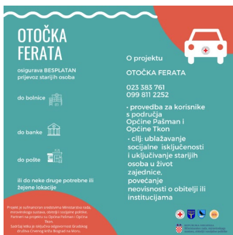
Slika 14. Letak projekta „Otočka ferata”