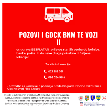
Slika 13. Letak projekta „Pozovi i GDCK BnM te vozi II“