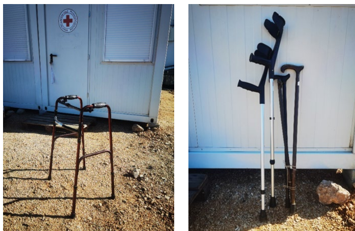
Slike 10. i 11. Ortopedska pomagala Posudionice

Od navedenog broja pomagala posuđeno je njih 29, a u 2024. godini izdano je 11 reversa.