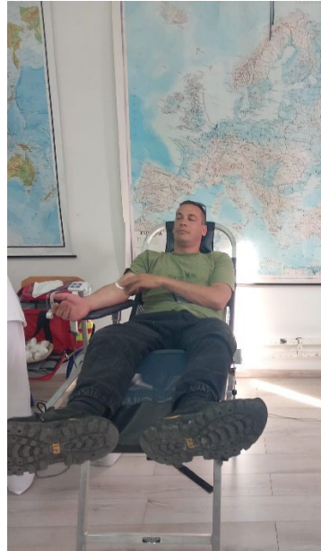
slika 6. i slika 7. Dobrovoljni darivatelji krvi