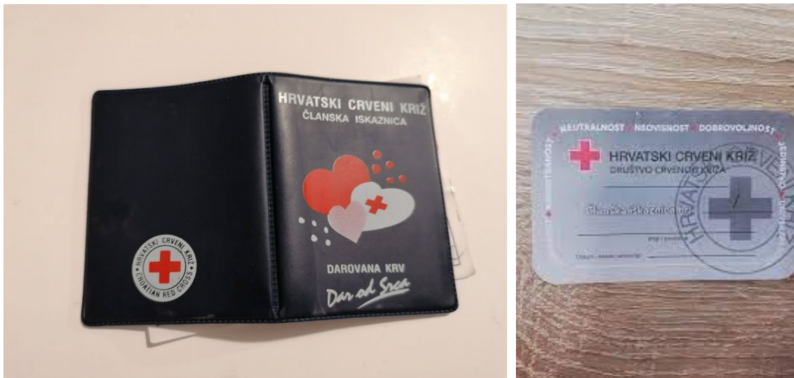
Slike 2. i 3. Članske iskaznice HCK