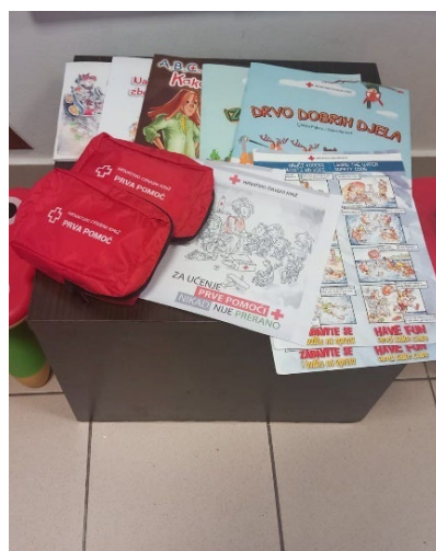
Slike 16. i 17. Provedba radionica u dječjem vrtiću