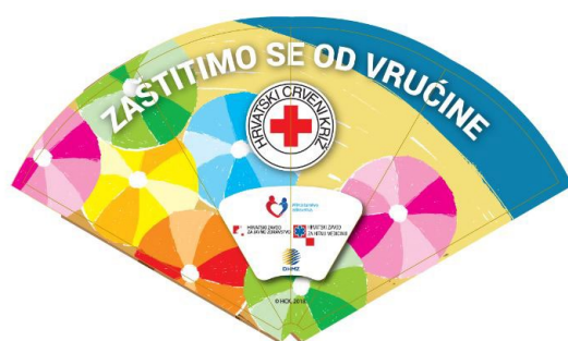
Slika 13. Kartonska lepeza „Zaštitimo se od vrućine“

U lipnju 2024. godine građanima su putem društvenih mreža podijeljeni savjeti za zaštitu od vrućine osobama starije životne dobi, a podijeljene su i promotivne kartonske lepeze „Zaštitimo se od vrućine“ koje je izradilo Ministarstvo zdravstva, Hrvatski zavod za javno zdravstvo, Hrvatski zavod za hitnu medicinu i DHMZ starijim osobama te dobrovoljnim darivateljima na akcijama dobrovoljnog darivanja krvi. Svi važni datumi obilježeni su online, preko društvenih mreža i web stranice GDCK.