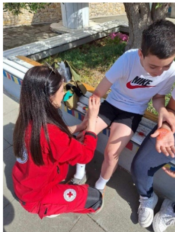
Slike 27. i 28. Vježba sustava civilne zaštite