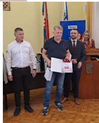
slike 6., 7. i 8. Dodjela zahvalnica dobrovoljnim darivateljima krvi