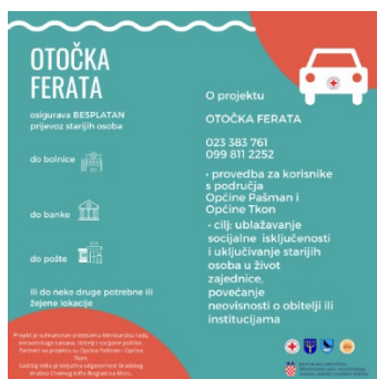
Slika 21. Letak projekta „Otočka ferata“