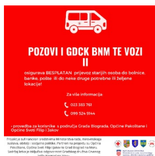
Slika 20. Letak projekta „Pozovi i GDCK BnM te vozi II“