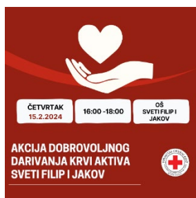
slika 4. i slika 5. Objave DDK na društvenim mrežama