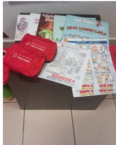
Slike 24. i 25. Provedba radionica u dječjem vrtiću