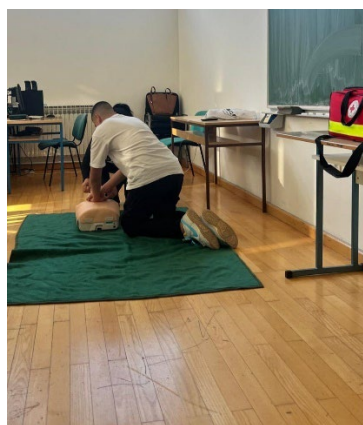
Slike 11. i 12. Prva pomoć u DV „Gardelin“ Pakoštane i SŠ Biograd na Moru

Prikaz održanih tečajeva prve pomoći u 2024. godini