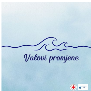
Slika 23. logo projekta „Valovi promjene“

Projektne aktivnosti zaočete su u studenom 2024. godine, a trajat će do kraja siječnja 2025. godine.