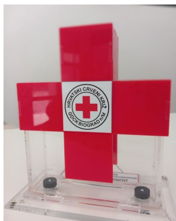
slika 19. Donacijska kasica HCK GDCK Biograd na Moru

U izvještajnom razdoblju u donacijskim kasicama prikupljeno je ukupno 328,35 EUR te 12,2 kg školskog pribora u papirnici Dakor.