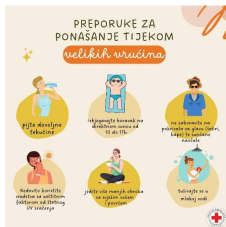
Slike 31. i 32. Objave na društvenim mrežama