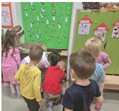
Slike 17. i 18. „Solidarnost na djelu 2024“3.4.4. HUMANITARNA POMOĆ

Hrvatski Crveni križ (HCK) na temelju Zakona o Hrvatskom Crvenom križu potražuje, sakuplja i dijeli humanitarnu pomoć međunarodnih organizacija i svih voljnih donatora te nacionalnih društava Crvenog križa i Crvenog polumjeseca za potrebe na području Republike Hrvatske. Pokrećemo, organiziramo i provodimo redovne i izvanredne akcije prikupljanja sredstava za pomoć osobama u potrebi – žrtvama oružanih sukoba, prirodnih, ekoloških, tehnoloških i drugih nesreća te osobama koje žive u teškim materijalnim uvjetima te osigurava čuvanje određenih količina materijalnih dobara za situacije potrebe.