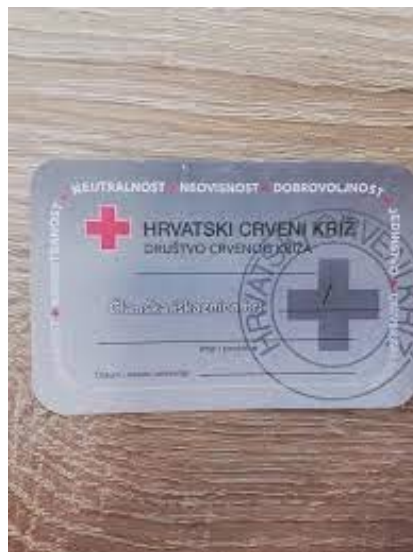
Slike 2. i 3. Članske iskaznice HCK