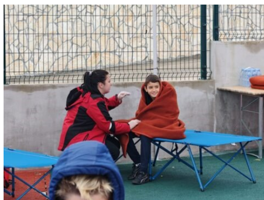
Slike 29. i 30. Vježba „Požar u školi – Tkon 2024.“