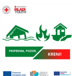
Slika 22. Logo projekta „Priprema, pozor, kreni!“

vrednovanje kao što je Youthpass – instrument za vrednovanje i priznavanje u programu „Mladi na djelu“. Projekt „Priprema, pozor, kreni!“ sufinancira Agencija za mobilnost i programe Europske unije u iznosu od 6.888 EUR, a prijavljen je u okviru Europskih snaga solidarnosti kao Projekt solidarnosti. Trajanje projekta je 12 mjeseci. Od početka trajanja projekta održano je 7 radionica u DV „Gardelin“ Pakoštane s preko 100 polaznika, na temu priprema za krizne situacije te je nabavljena oprema, a održane su i 2 javne edukacije . Redovito se objavljivala i online kampanja na društvenim mrežama samog projekta, kao i na web stranici te društvenim mrežama GDCK Biograd na Moru. Provedba projekta je bila i medijski popraćena. Provedba projekta završila je 31. prosinca 2023. godine a krajnji izvještaj odobren je u travnju 2024. godine.