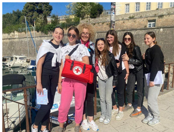
Slika 26. Pobjednička ekipa školskog natjecanja mladih HCK

Natjecanja mladih HCK održavaju se od 1996. i na njima je do sada sudjelovalo više od 120 tisuća učenika osnovnih i srednjih škola. Natjecanje se odvija na tri razine i to gradskoj, međužupanijskoj i državnoj, a provjerava se teorijsko znanje o Pokretu Crvenog križa, poznavanju ljudskih prava i prava djeteta te prve pomoći. Znanje prve pomoći na natjecanju se pokazuje i na praktičnim radilištima s realistično prikazanim situacijama i ozljedama. Državno natjecanje tradicionalno se odvija u Tjednu Hrvatskog Crvenog križa, traje četiri dana i prilika je za stjecanje novih znanja i vještina, stvaranje novih prijateljstava, upoznavanje kulturne i prirodne raznolikosti naše zemlje i pridruživanje Hrvatskom Crvenom križu. Školsko natjecanje GDCK Biograd na Moru održano je u Osnovnoj školi Sveti Filip i Jakov, 9. ožujka 2024. godine. Pobjednička ekipa Osnovne škole Sveti Filip i Jakov pod mentorstvom prof. Vesne Aralice sudjelovala je i na međužupanijskom natjecanju koje se održalo 13. travnja 2024. godine u Pomorskoj školi u Zadru, te je osvojila 2. mjesto u kategoriji Pomladak.